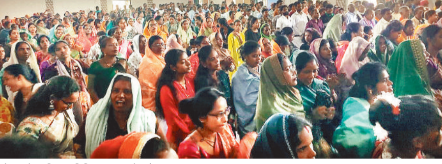
आयोजन में शामिल अतिथि व समाज के लोग।